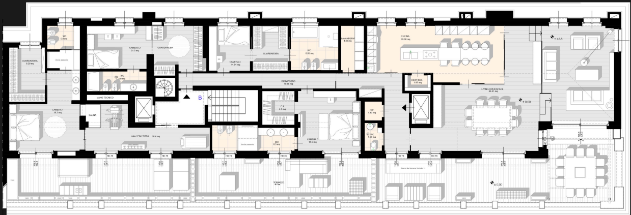
Pianta Piano Sesto Progetto scala 1/100

ND: Verificare misure, quote e sistema costruttivo da scegliere in sede esecutiva. Spessori per ponderare scarsi da realizzare o meglio dimensionare a oggi.